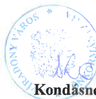
Kondásné Erdei Mária polgármester