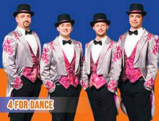
4 FOR DANCE