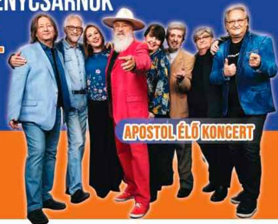
APOSTOL ÉLŐ KONCERT

JÚNIUS 24. PÉNTEK Elszármazottak Találkozója a Gencsy Kúriában Folk-éj a Dózsa György utcai Közösségi Házban Tér-Zene Trio Consort