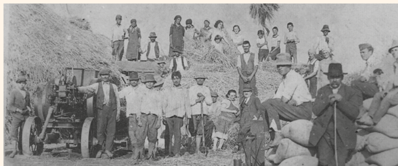
Cséplés után Nyíradony 1945 körül