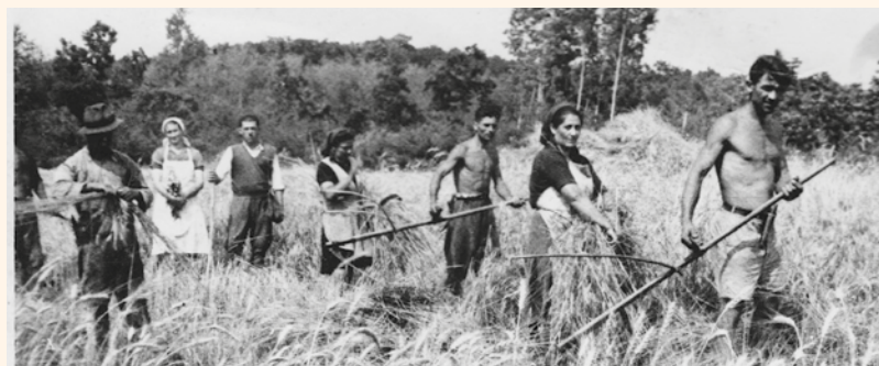
Aratás. Nyírmártonfalvi aratóbrigád. Gút 1951. július 10.