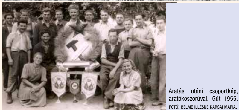
Aratás utáni csoportkép, aratókoszorúval. Gút 1955.