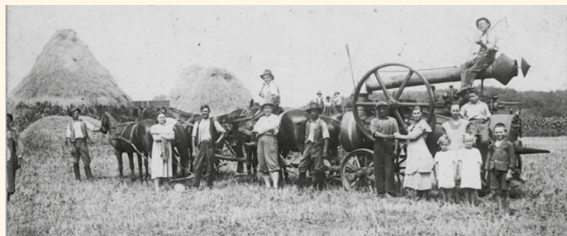
Cséplés után. Nyíradony, Tivorány 1937 körül