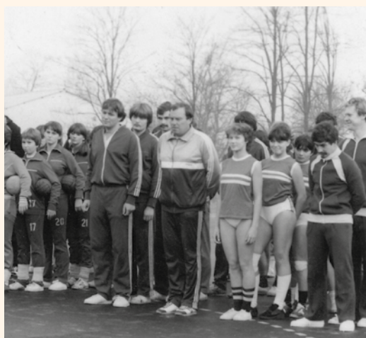
Tömegsportnap 1980 körül.