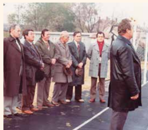
A bitumenpálya avatása. Községi előljárók részvételével. A pálya építés önerőből lett megoldva. 1985 körül