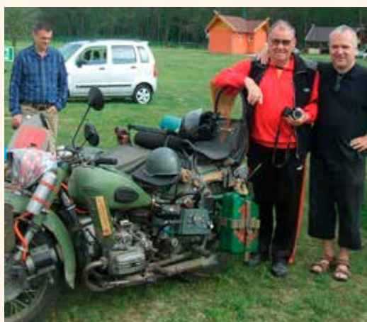
Egy másik szerelem. Veterán motoros kiállítás 2013 Nyíradony Európa Park.