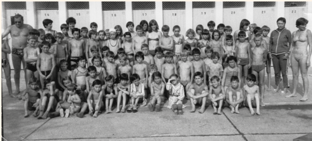
Az első úszótanfolyam nyíradonyi gyerekeknek 1976. körül Debrecen Nagyerdő