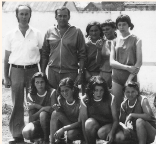
Az első nyíradonyi női kézilabda csapat 1973-1974 körül.