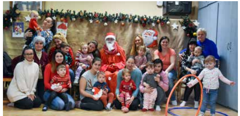
• BABA-MAMA MIKULÁS