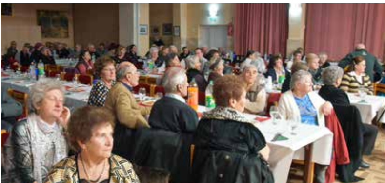
• NYÍRADONYI NYUGDÍJAS TALÁLKOZÓ