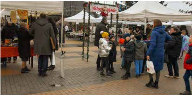
• ADVENTI VÁSÁR