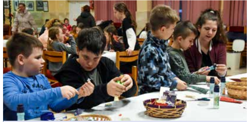
• ADVENTI KÉZMŰVES FOGLALKOZÁS A NÉPTÁNCOSOKKAL