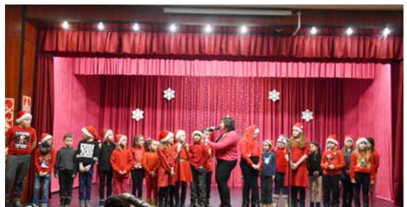
• VÁROSI MIKULÁS