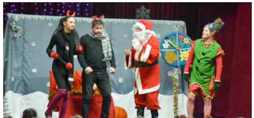
• PÓDIUM SZÍNHÁZ MIKULÁS