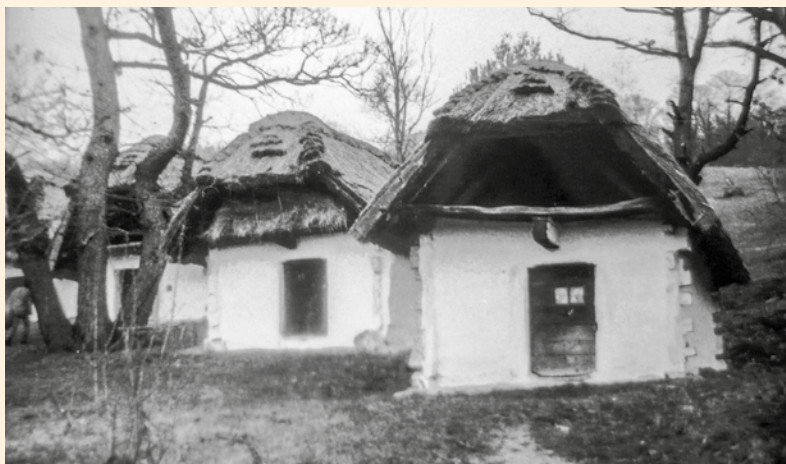
Nagy-tivorányi cselédházak 1940-es évek.