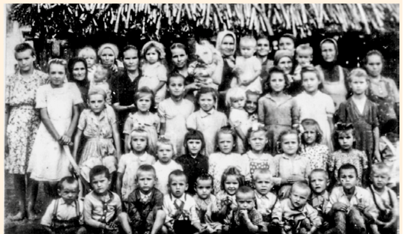
Tivorányi családok 1948