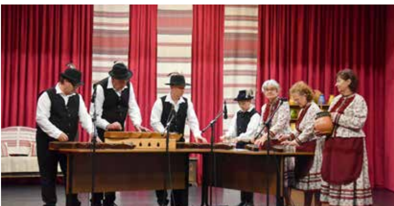
• NÉPZENEI TALÁLKOZÓ