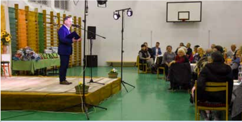
• ARADVÁNPUSZTAI NYUGDÍJAS TALÁLKOZÓ